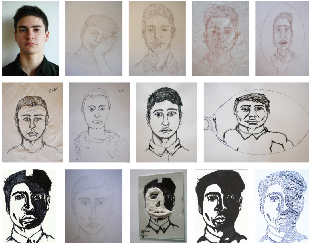
Fig. 6. PES II. Evolução do trabalho, desenvolvido pelo aluno nº 22.

à importância da unidade para o aluno, dos 23 alunos, um não respondeu mas todos os outros (95,7%) disseram que foi vantajosa dando como principais motivos: conhecimento dos cânones, maior rapidez de percepção das formas e realização da representação, novo tema/método/técnicas, diferentes suportes, maior precisão das proporções e fidelidade do modelo e conhecimento próprio. O aluno nº 2 mencionou que foi a unidade mais produtiva que alguma vez a turma teve. Estes resultados foram sem dúvida muito animadores quando se constata a semelhança de percentagens com a turma anterior. Questionados sobre a importância do tato, no desenvolvimento da temática do rosto, ao que 19 alunos (82,6%) responderam positivamente, 2 (8,7%) responderam que não e outros 2 (8,7%) não responderam. Relativamente à questão sobre a diferenciação entre o que sentiram, da aula nº 1 para a última (nº 6), 20 alunos (87%) afirmaram terem sentido diferenças, 2 alunos (8,7%) não e, um último (4,3%) não respondeu. Como principais diferenças, os alunos, apontaram: maior rapidez na realização, interiorização dos cânones/proporções, fidelidade do desenho à representação do real, maior percepção das formas e claro-escuro, novo método de análise/síntese, melhor autoconhecimento e ainda maior fluidez e segurança no traço, na representação dos rostos.