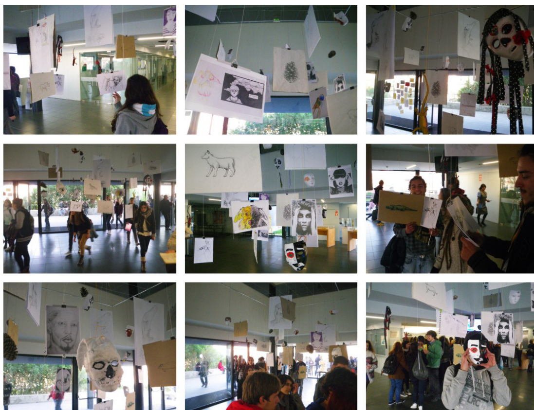
Fig. 7. Exposição “Desenho tátil” na EASR. Interação da comunidade escolar.

Fazendo ainda uma ampla retrospectiva às unidades didáticas, planificadas e implementadas, permitiram alcançar uma perceção mais “significativa” na medida que o tato apoiou não só a análise como a representação gráfica do real.