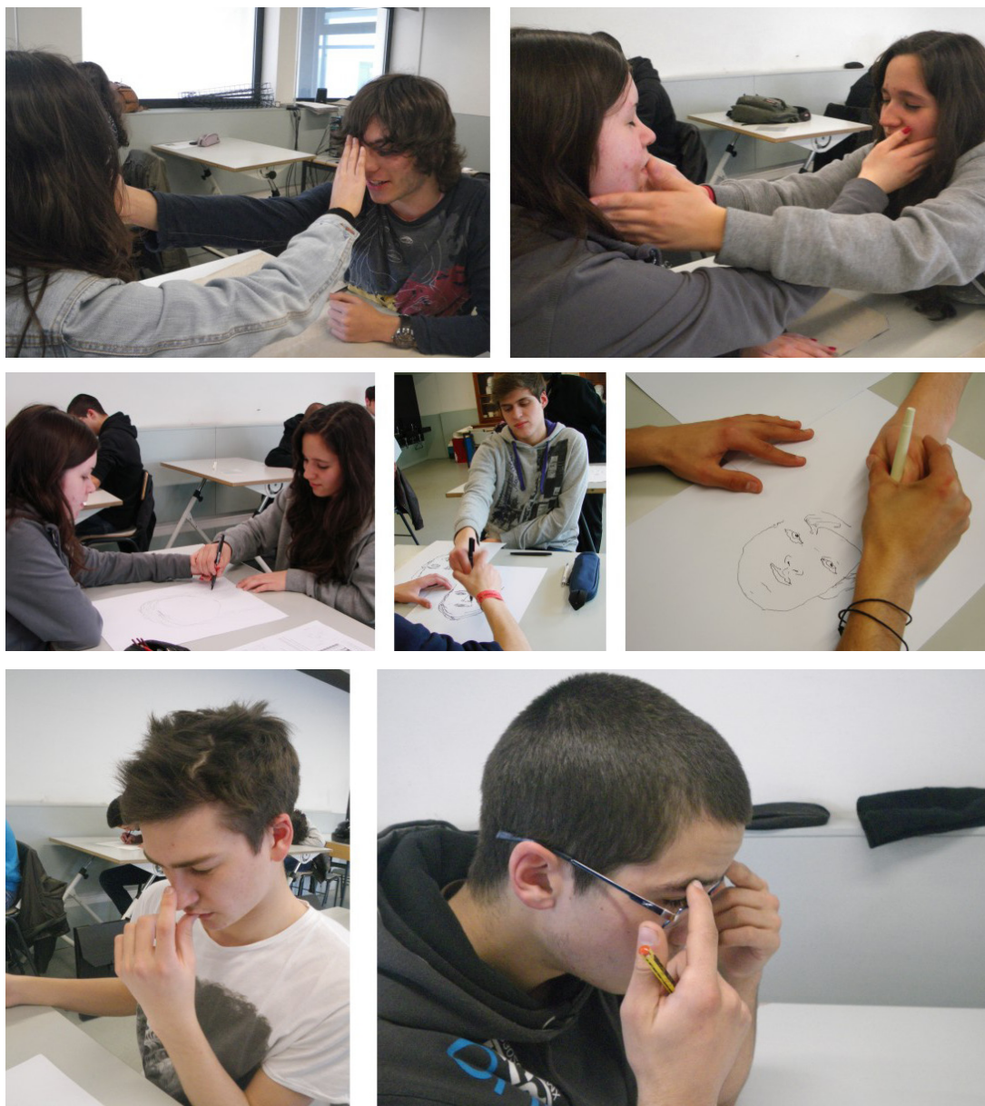
Fig. 5. PES II – processo da aula nº 3 e nº 5.

Da outra avaliação global da unidade, aos 23 alunos da turma PES II, foi possível constatar que 16 alunos (69,6%) disseram ter tido “muita satisfação” na unidade, 6 (26,1%) “alguma satisfação”, 1 que não respondeu e, nenhum aluno referiu ter tido “pouca satisfação”. Relativamente