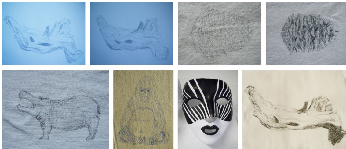
Fig. 4. Aula nº 1 a nº 6 (PES I). Evolução do trabalho, desenvolvido pelo aluno nº 13.

Em ambos tipos de alunos a representação foi ficando mais aproximada do real, e identificada com a forma, constatando-se através das proporções, textura, claro-escuro e expressividade, respetivamente.