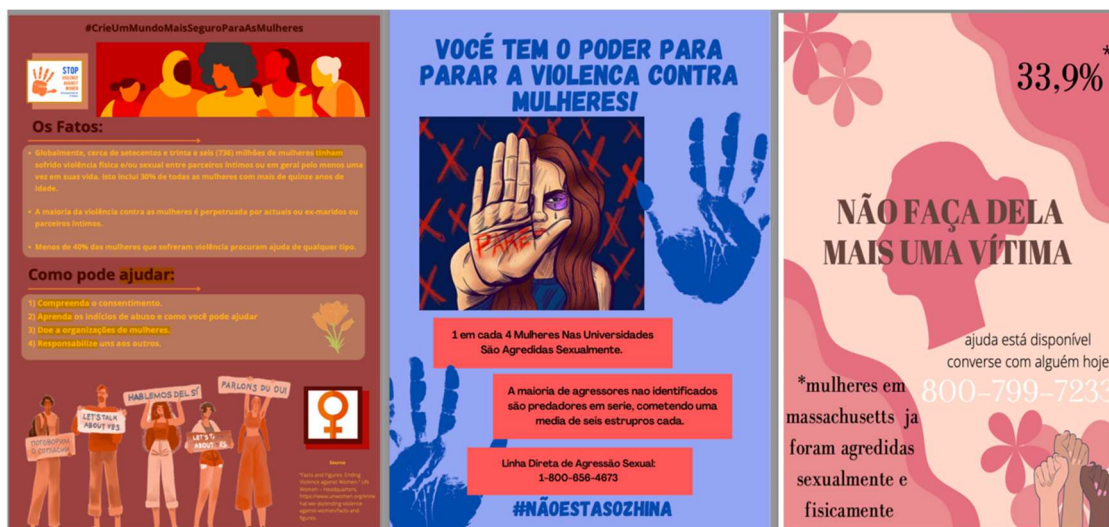
Imagem: Pôsteres para a campanha contra a violência contra a mulher (Bianconi, 2024).

A tarefa interpretativa de leitura usa a observação de padrões de comportamento (prática cultural tangível) para a avaliação apreciativa da crônica, enquanto a tarefa interpessoal prioriza o questionamento a partir da discussão de dados estatísticos reais (perspectiva cultural tangível). Para finalizar o roteiro progressivo de engajamento proposto por Bianconi (2024), a tarefa expositiva foca na criação de pôsteres, hashtags , campanhas publicitárias e folhetos como materialização da denúncia (produto cultural tangível).